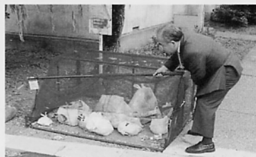
カラス対策の調査に 桜堤付近にて

防災・環境浄化・福祉を考慮した、快適で人にやさしく、安心して暮らせる街づくり、コミュニティづくりを目指します。新しい時代に対応した商工業活動、市民の多様な文化活動等を支援し、活力ある地域社会を実現します。