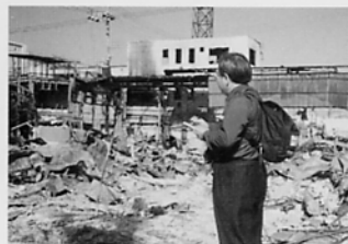
H7年1月17日、阪神淡路大震災。同年1月28日、臨時増刊号「武蔵野市の防災体制は今」発行。2月18～19日、神戸を中心に視察