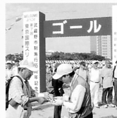
スリデーマーチ H14年5月3日～5日 3日間で60kmを無事完歩