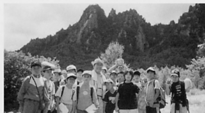
いつも子どもたちとともに 川上村ジャンボリーにて

武蔵野市で大胆な独自のカリキュラムをつくり、好奇心・創造力・情熱・意欲を持った子どもたちを、学校・地域・家庭との連携で育てます。多様な保育ニーズに応じて、働くお母さん方を応援し、子育て支援を充実させます。