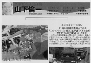
H10年11月11日「インターネットを使った市政情報とは？」のテーマでいち早くホームページ開設。H14年12月17日、アクセス1万回超える