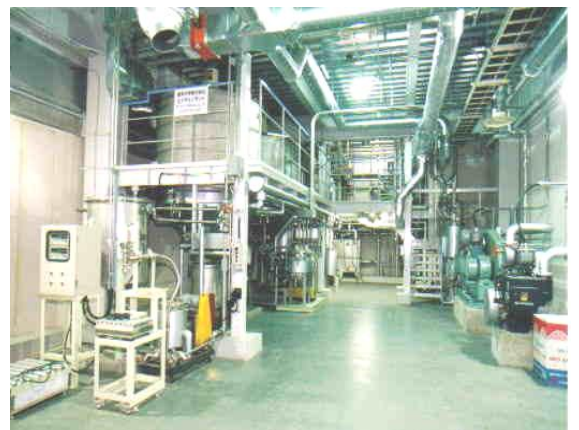
びわ湖工場エステルプラント