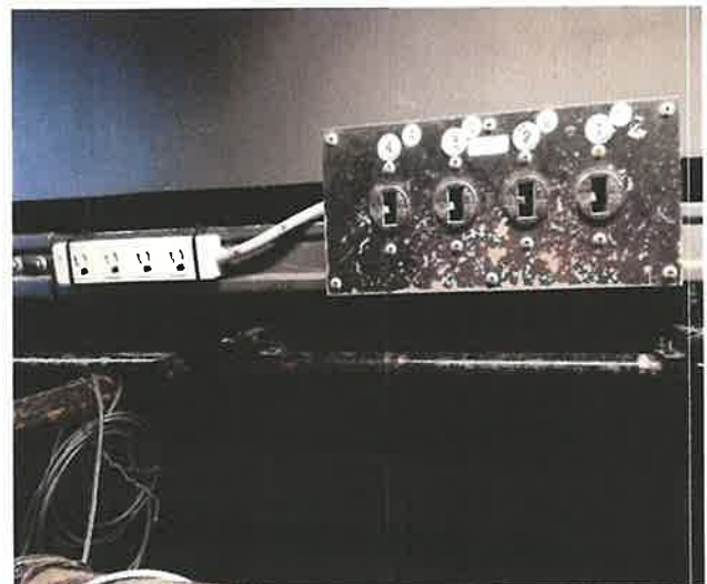
1SUS ①～④の回路ボックス横 (直①)