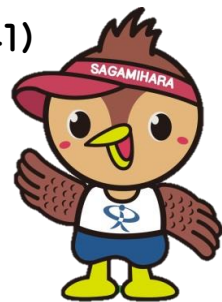
公認マスコット「すぼっち」