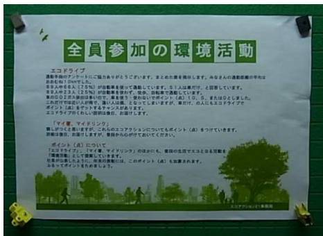
●エコドライブの実施 燃費向上のチェック