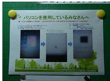
●PC・プリンター省エネ設定