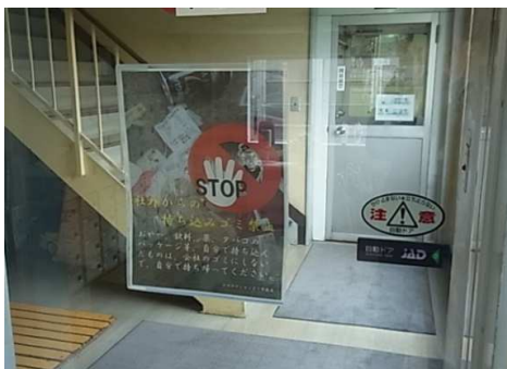
●社内からの持込みゴミ廃棄禁止の表示