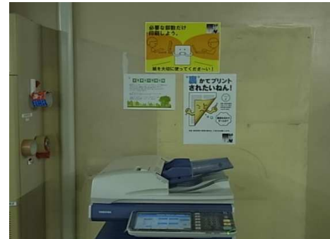
●使用済みコピー用紙再利用の徹底表示 ●ミスコピーの防止の表示