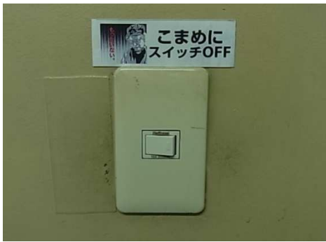
●不要な照明の消灯の表示